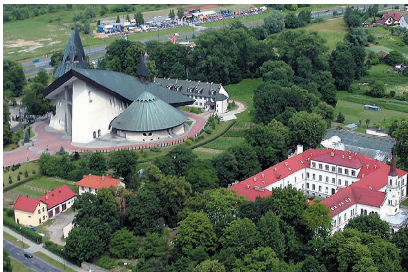
Biały Klasztor i kościół Matki Bożej Niepokalanej