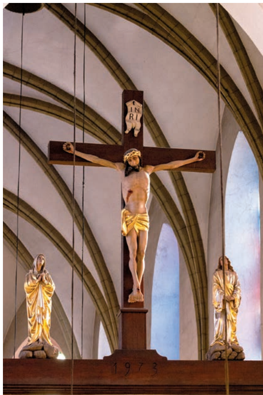
Ukrzyżowanie na belce tęczowej

ników świeckich z królami Zygmuntem III i Władysławem IV); w strefie środkowej przedstawieni są święci orędownicy – Franciszek i Dominik; u góry natomiast Trójca Święta i klęcząca u stóp Chrystusa Matka Boska 39 .