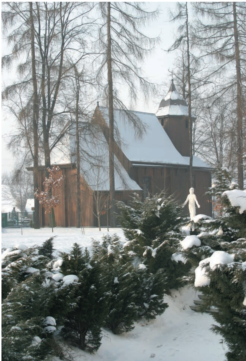
Kościół św. Rocha