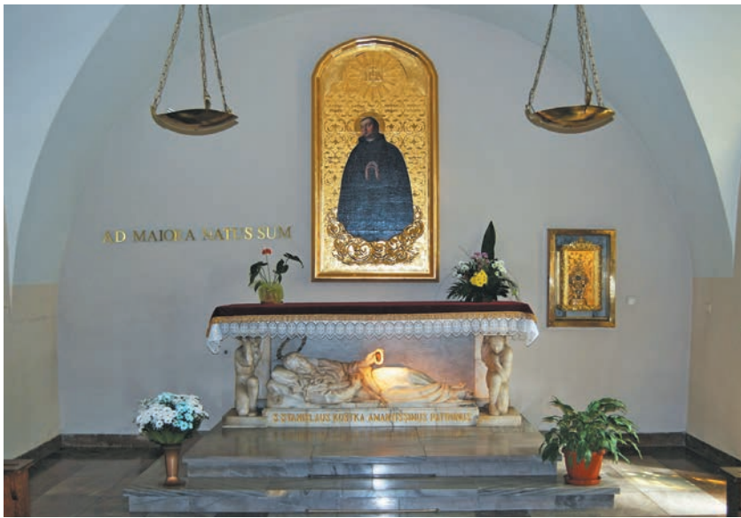
Kaplica św. Stanisława Kostki