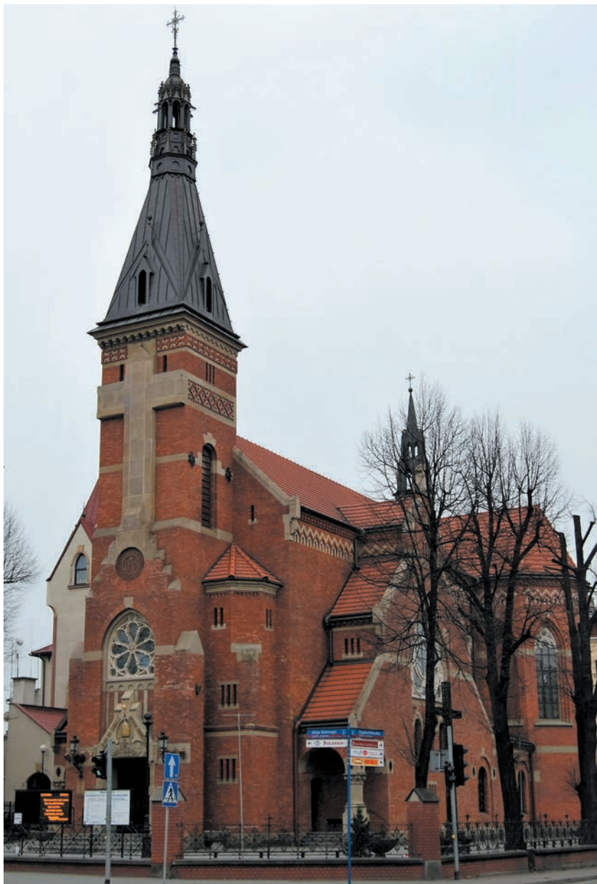
Kościół Najświętszego Serca Pana Jezusa