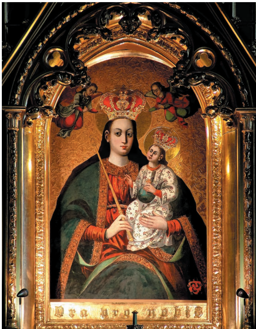
Obraz Matki Bożej Pocieszenia

ga odległych czasów i potwierdzona została w najstarszych dokumentach miejskich. Już w 1486 r. odnotowano w aktach grodzkich pierwszą wzmiankę o datku złożonym przez jedną z mieszczek „na nowy obraz Panny Marii”. Fakt ten świadczy o istnieniu nieznanego malowidła przedstawiającego