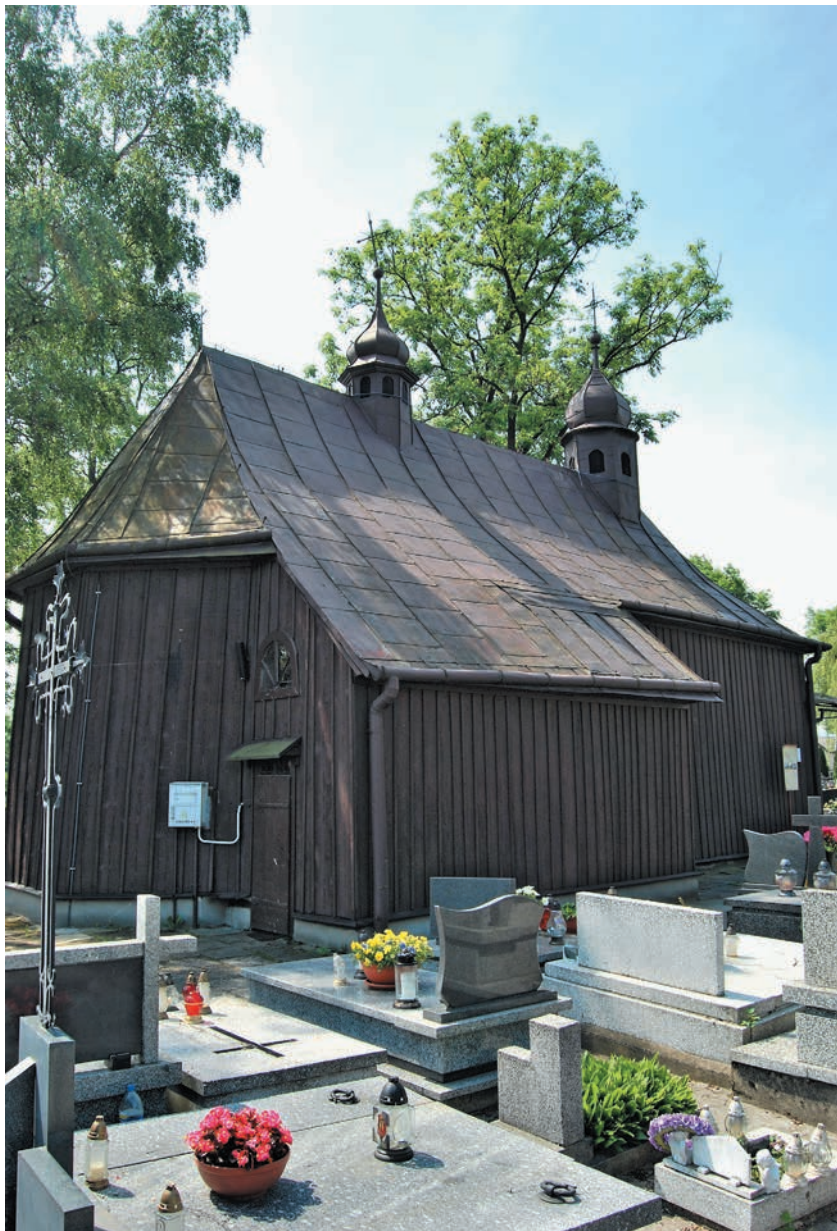
Kościół św. Heleny