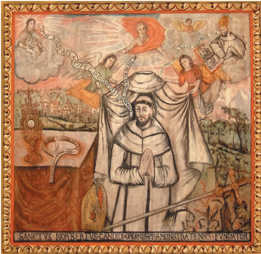
Św. Norbert – fragment malowidła na stropie