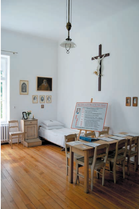
Cela bł. Marceliny Darowskiej

w nienajlepszym stanie, skoro Matka Marcelina tak pisała o nich w swoich pamiętnikach: „dwa budynki stare i nędzne, zapuszczenie niedbałe, niegospodarne, zniszczenie i nieład wszędzie” 5 . Mimo to zdecydowała się ona na założenie nowej siedziby zakonu w Nowym Sączu, do czego listownie,