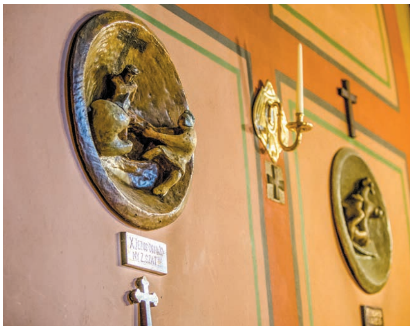
Stacje drogi krzyżowej Władysława Hasióra