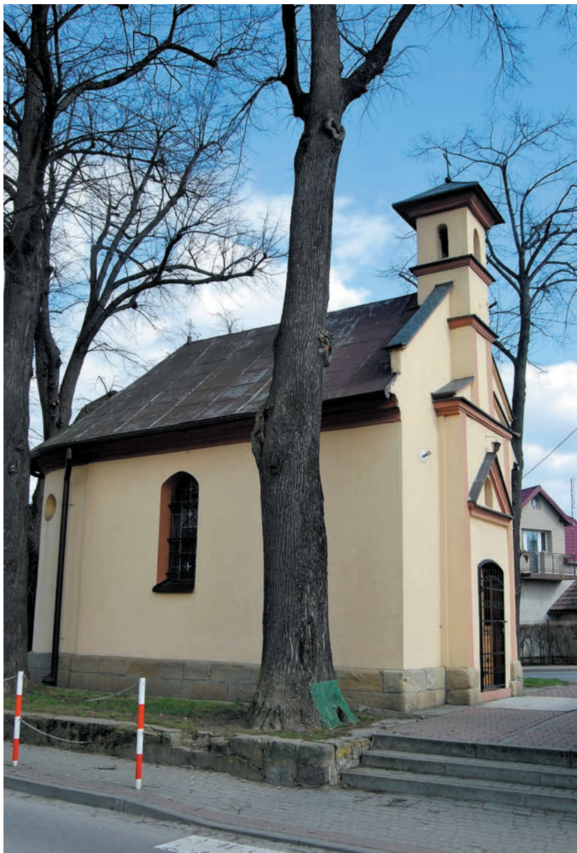
Kaplica Świętego Krzyża