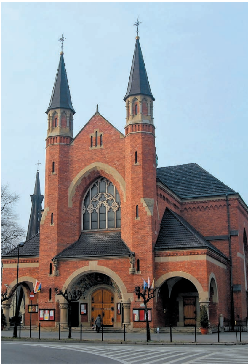
Kościół św. Kazimierza