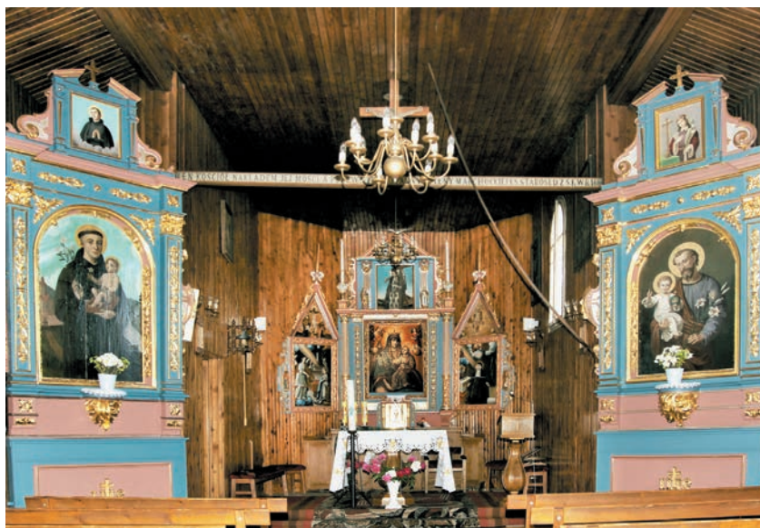
Prezbiterium z obrazem Matki Bożej z Dzieciątkiem