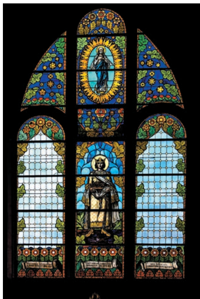
Witraże św. Ludwika i św. Kazimierza