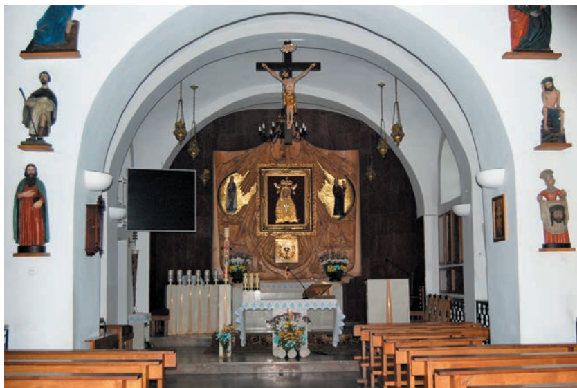
Prezbiterium z obrazem Matki Boskiej Licheńskiej

okna. Pod każdym z nich i na ścianie absydy z znajdują się tablice epitafijne różnej wielkości. Fasada posiada prostokątne wejście na osi, ponad nim półokrągłe okno oraz trójkątny szczyt z lekko wklęsłymi bokami i ściętym wierzchołkiem. Na północnej ścianie dobudowana kwadratowa zakrystia, z prostokątnym wejściem od zachodniej ściany. Na ścianie północnej dwa zakończone półkoliście okna.