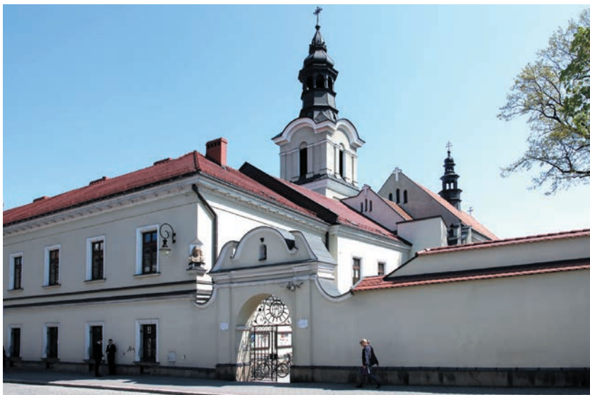
Kompleks jezuitski od południowego zachodu