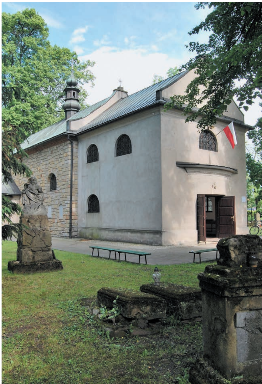
Kościół Niepokalanego Poczęcia NMP