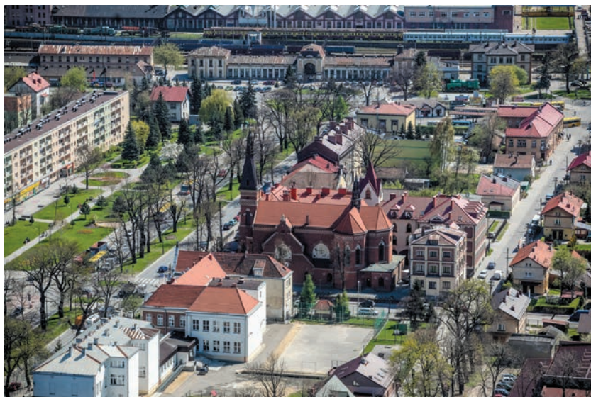
Kościół NSPJ w dzielnicy kolejowej