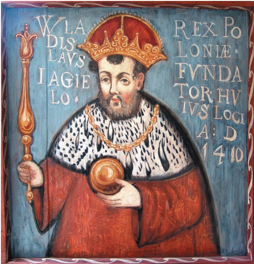
Władysław Jagiełło – fragment malowidła na stropie