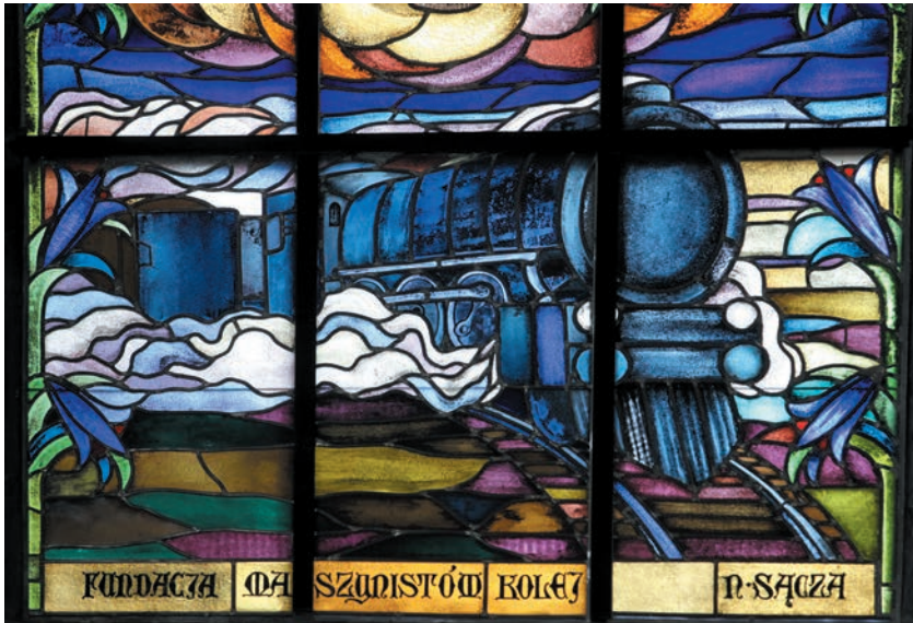
Fragment witraża z parowozem