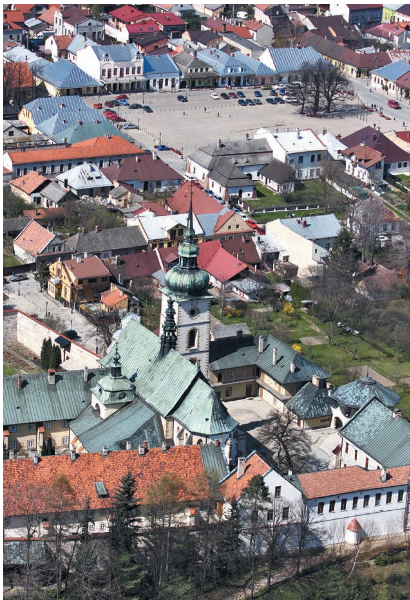
Średniowieczny układ miasta z rynkiem oraz kościołem i klasztorem Klarysek