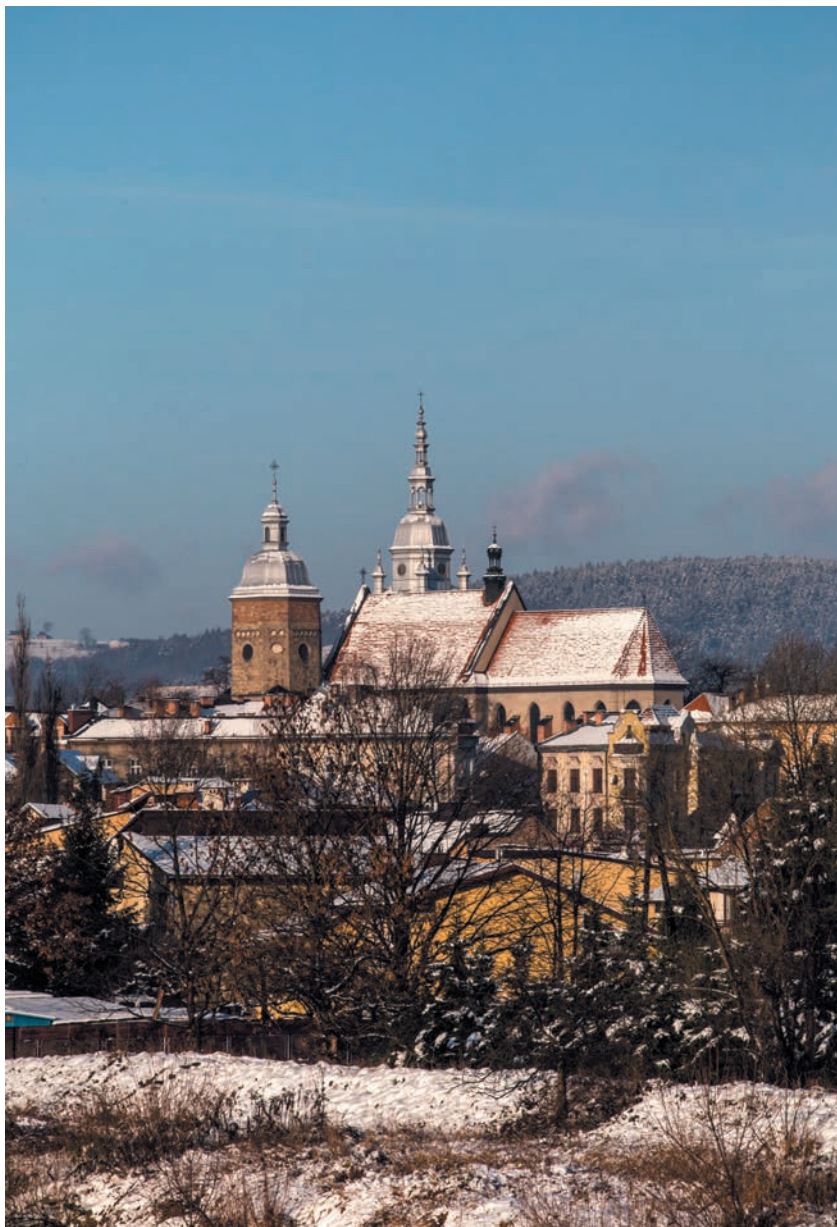
Bazylika św. Małgorzaty od strony południowo-wschodniej