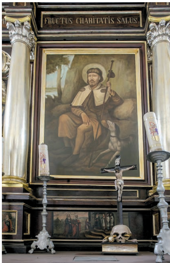
Św. Roch w ołtarzu głównym

Tęcza z barokowym krucyfiksem oraz klęczącą figurą Marii Magdaleny z drugiej połowy XVIII w. Na belce umieszczony napis: „Któryś dla nas cierpiał rany, Jezu Chryste zmiłuj się nad nami”, natomiast po