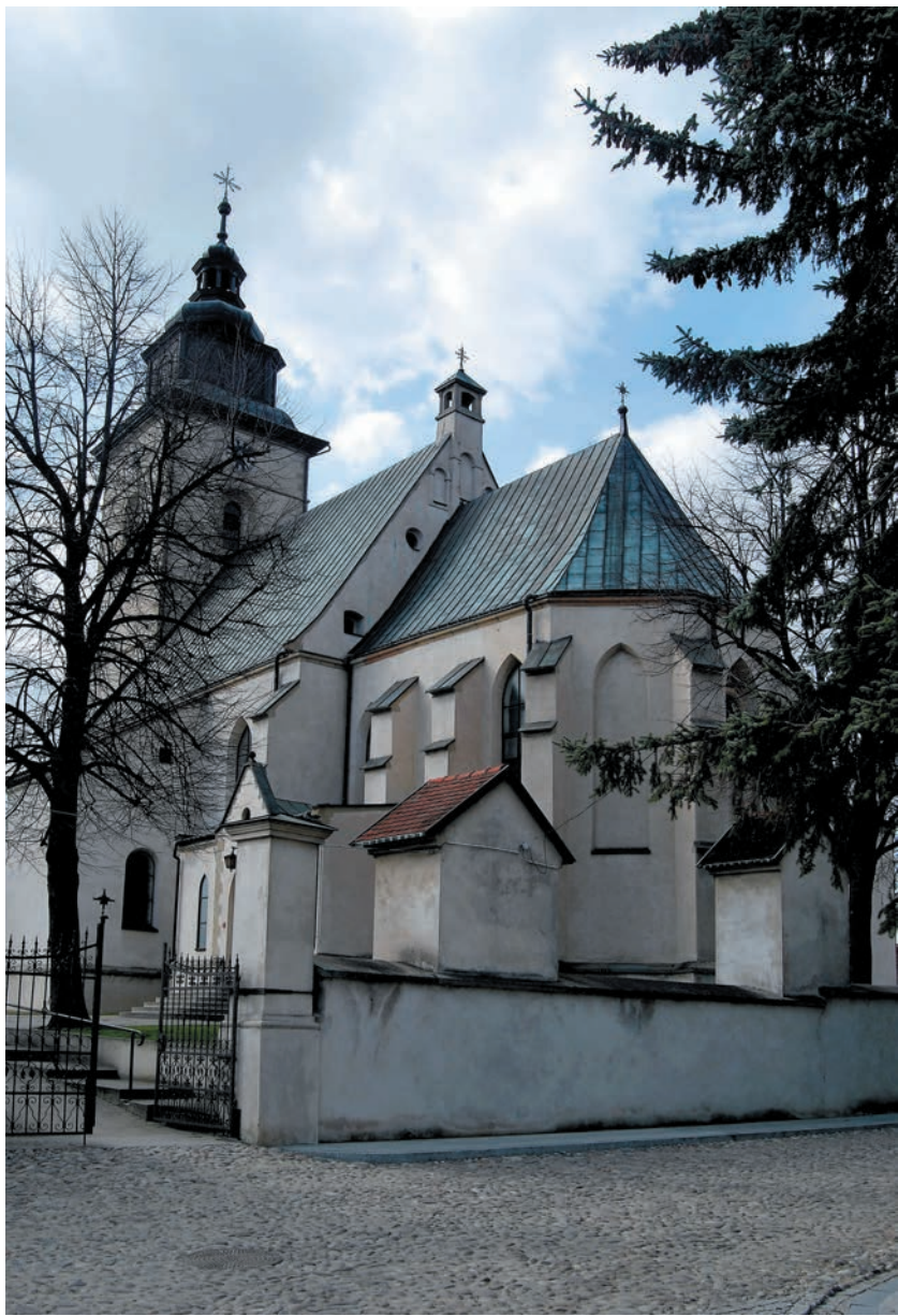
Kościół św. Elżbiety Węgierskiej od strony południowo wschodniej