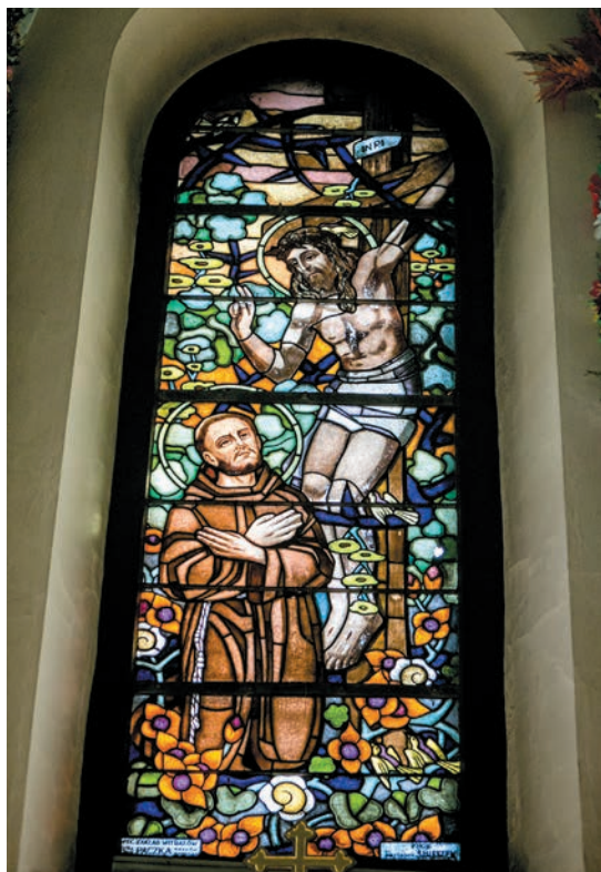
Witraż ze św. Franciszkiem u stóp Ukrzyżowanego

Sączu. Obraz ten flankują postacie dwóch aniołków, ustawione na profilowanych podstawach, pod baldachimami na trzech kolumnkach. W centrum zdobionego ornamentem maswerkowym antepedium znajduje się czworobok z mariogramem. Lewy ołtarz boczny w kaplicy, trójosiowy, jednokondygnacyjny, poświęcony jest Matce Bożej Różańcowej. W środkowej, ostrołukowej wnęce retabulum znajduje się rzeźbiona grupa Matka Boska z Dzieciątkiem, wręczająca różaniec św. Dominikowi, zasłaniana w okresie Wielkiego Postu obrazem Zdjęcie z krzyża , malowanym na płótnie. Po bokach, nad mensą, namalowano sceny: Zwiastowanie i Wniebowzięcie NMP , a nad malowidłami, w pięciobocznych wnękach, umieszczone są figury św. Jadwigi Śląskiej i św. Anny, która naucza Marię. Antepedium składa się z trzech kwadratowych płyt, w które wpisano motywy czteroliścia i – w środkową – mariogram.