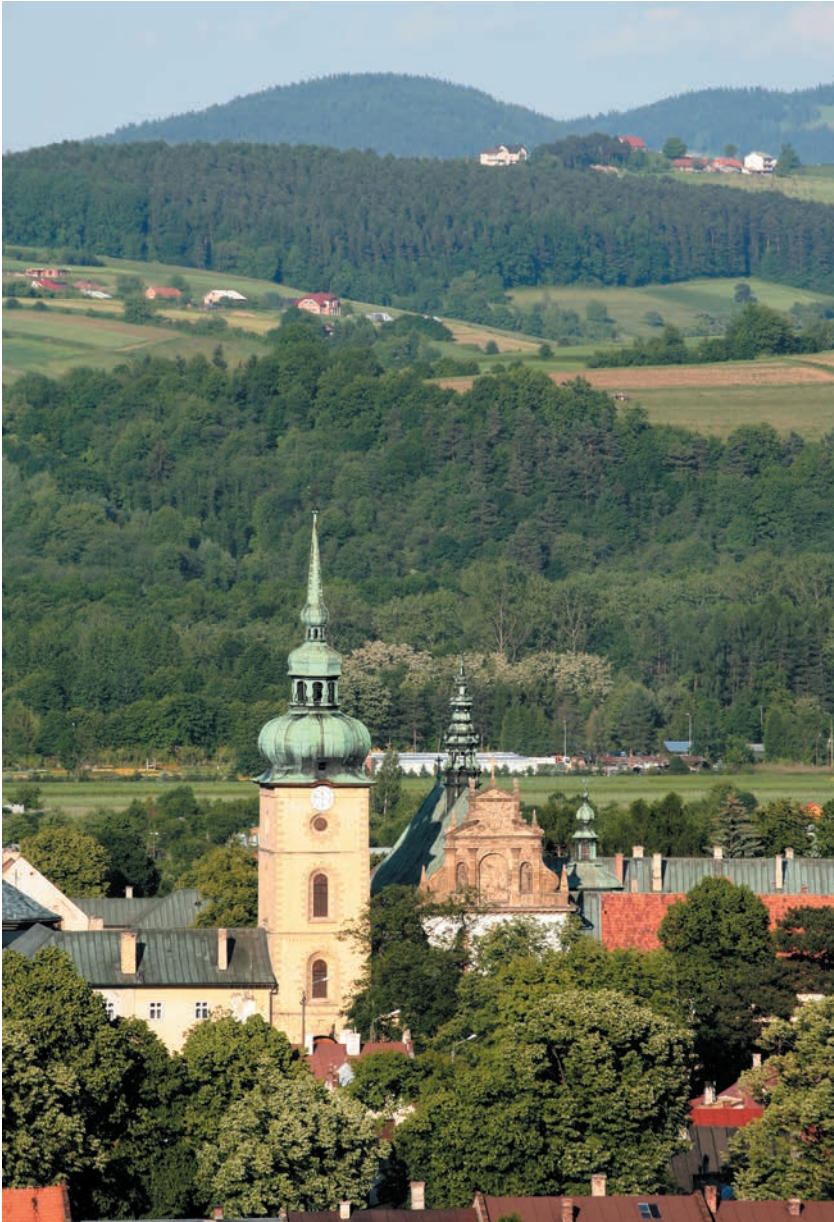
Kościół Świętej Trójcy i klasztor Klarysek od strony zachodniej