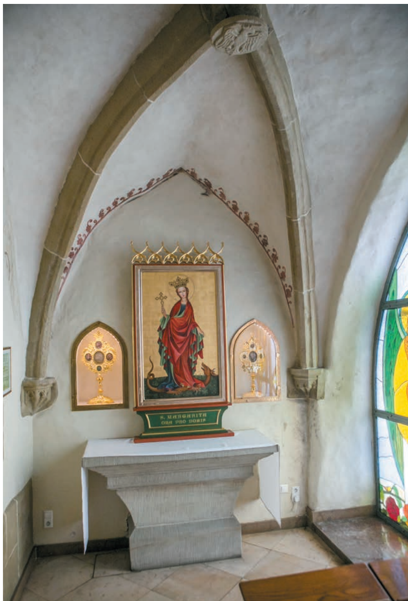
Kaplica św. Małgorzaty