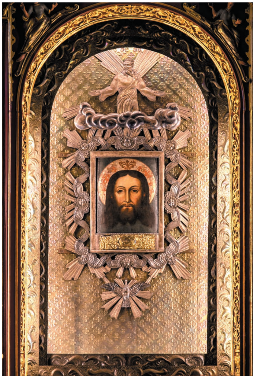
Przemienienie Pańskie w ołtarzu głównym