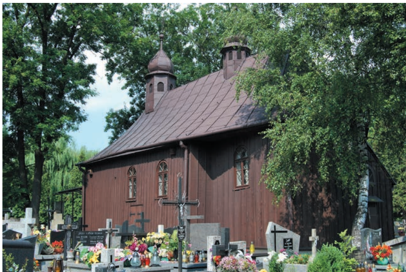
Kościół od południowego wschodu