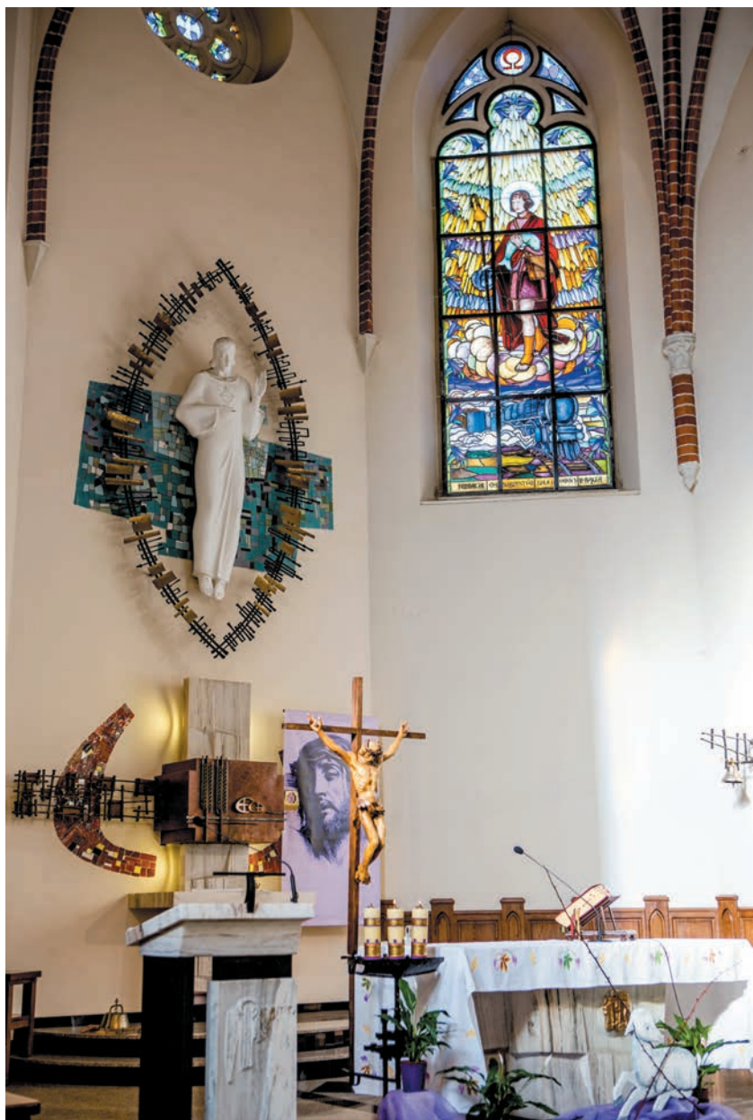
Ołtarz główny z lat osiemdziesiątych XX w.