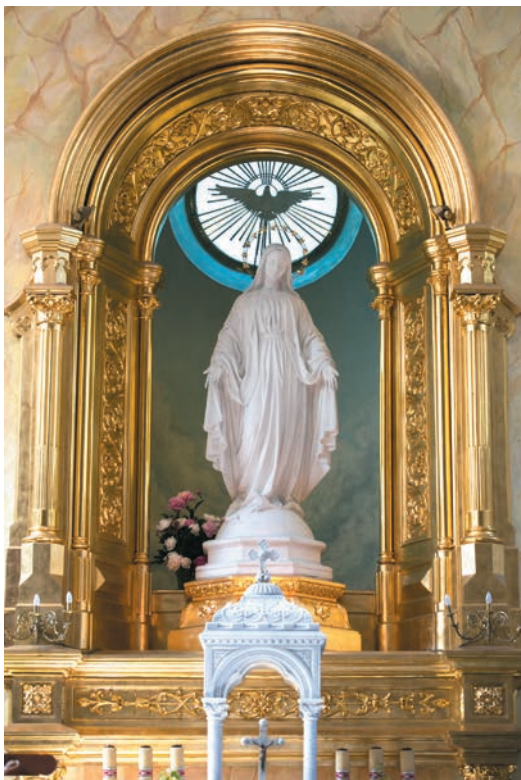
Figura Matki Boskiej w oltarzu kaplicy klasztornej