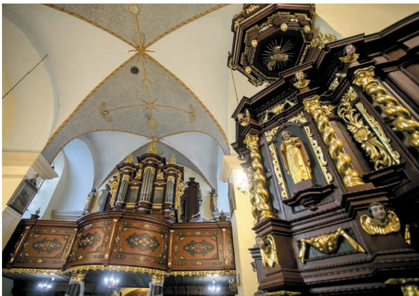
Barokowe organy i ambona

Prospekt organowy w stylu barokowym datuje się na 1679 r. 49 i uznaje, iż powstał w krakowskiej pracowni Jana Głowińskiego 50 . Podczas prac