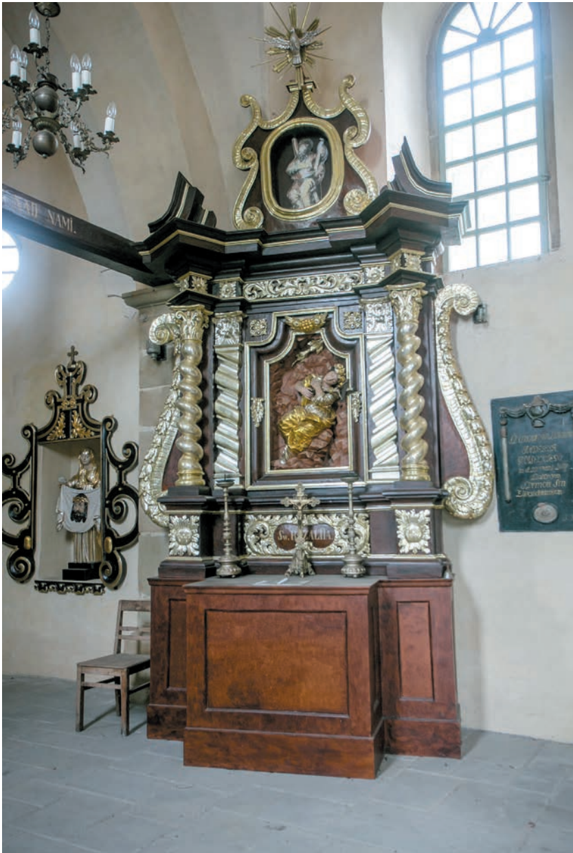
Św. Roch w ołtarzu bocznym