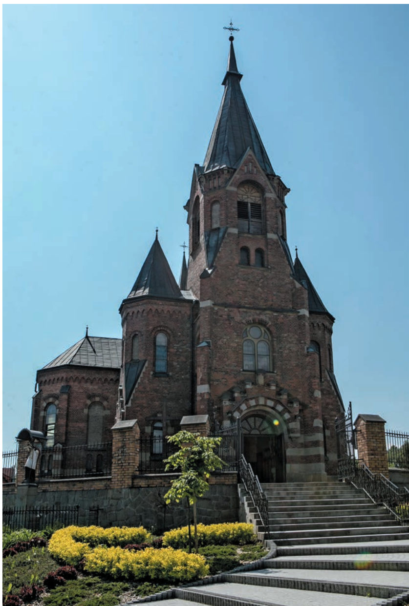
Kościół św. Wawrzyńca