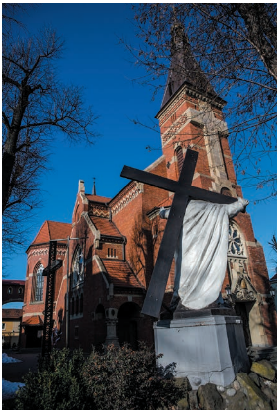
Kościół NSPJ z figurą Pana Jezusa