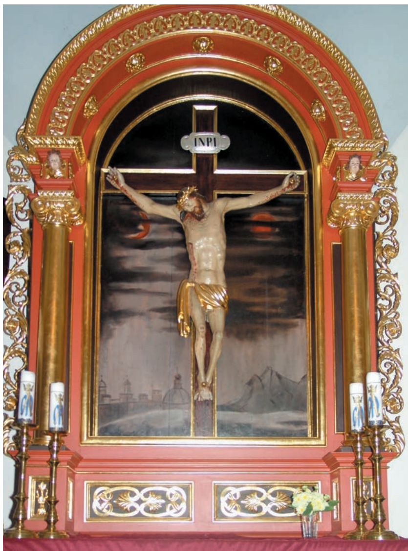
Ukrzyżowanie we wnętrzu kaplicy