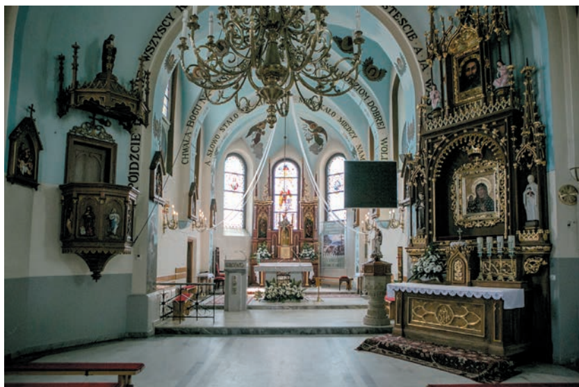
Nawa główna i prezbiterium