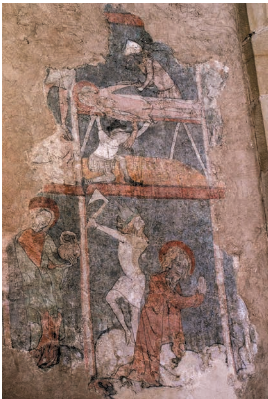
Fragment gotyckiej polichromii w prezbiterium