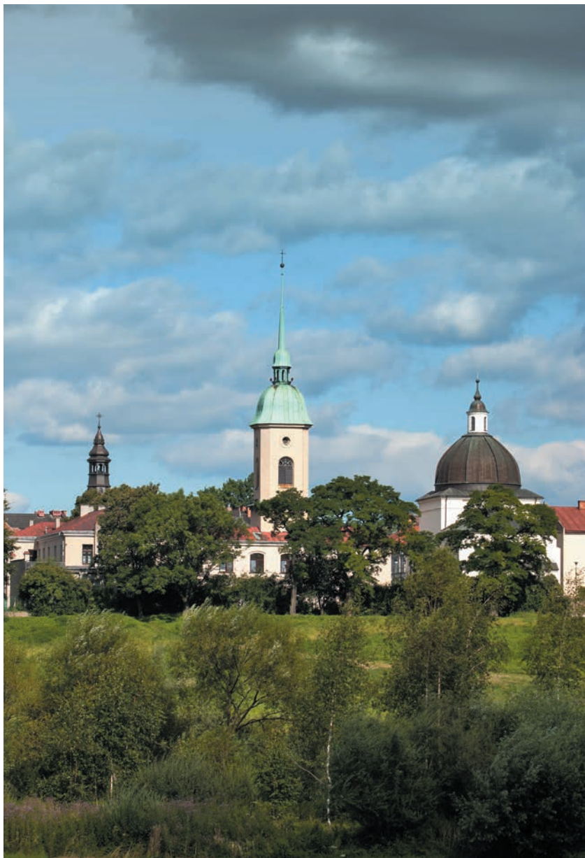
Dawny zespół franciszkański od strony zachodniej