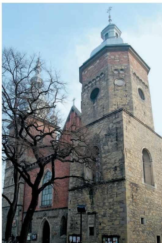
Wieża od południowego zachodu

Obok prac konserwatorskich i renowacyjnych kościoła farnego, nie mniej istotną sprawą pozostawała kwestia terytorialnej reorganizacji pracy