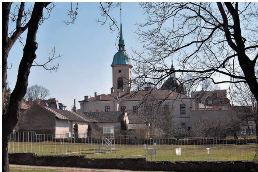
Dawny kościół i klasztor Franciszkanów od strony północnej