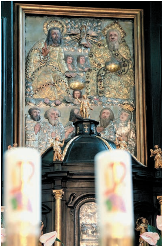
Święta Trójca w ołtarzu głównym

Do wnętrza świątyni prowadzi szeroki przedsionek z żelaznymi kutymi drzwiami. Przy wejściu znajduje się kamienna kropielnica z XVI w. Gotyc-