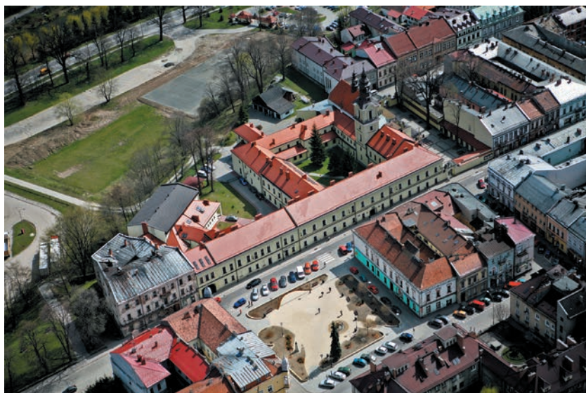
Północno wschodnia część Starego Miasta z kościołem i klasztorem Jezuitów

W 1950 r., wobec groźby likwidacji klasztoru, przy kościele Świętego Ducha utworzono wikarię parafialną, a w roku 1961 pełnoprawną parafią. W latach 1962–1982 kościół przeszedł generalny remont. Zadbano też o dziedziniec przykościelny. Zbudowano na nim ołtarz polowy oraz krużganki z dwóch stron placu. W arkadach krużganków wymodelowano płaskorzeźby tajemnic różańcowych.