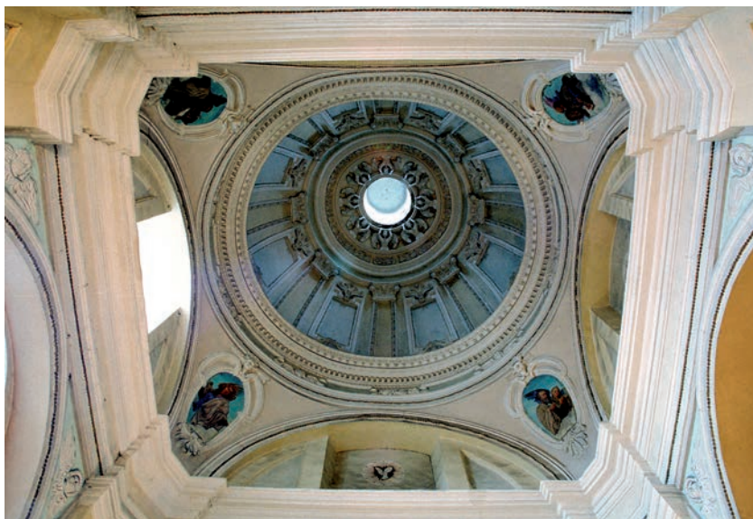
Kopuła z latarnią nad dawną kaplicą Przemienienia Pańskiego

Pożar w 1753 r. nadwyrężył mury kościoła Franciszkanów w Nowym Sączu, w wyniku następnego w 1769 r. świątynia została ponownie znisz-