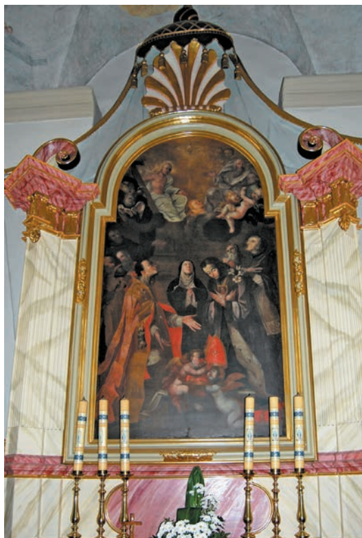
Śluby św. Kingi

Na południowej ścianie nawy, między ołtarzami bocznymi, wyeksponowano wartościowy, późnorenesansowy obraz Święta Anna Samotrzeć powstały prawdopodobnie na początku XVII w. 56 Maryję, św. Annę i Dzieciątka Jezus przedstawi-