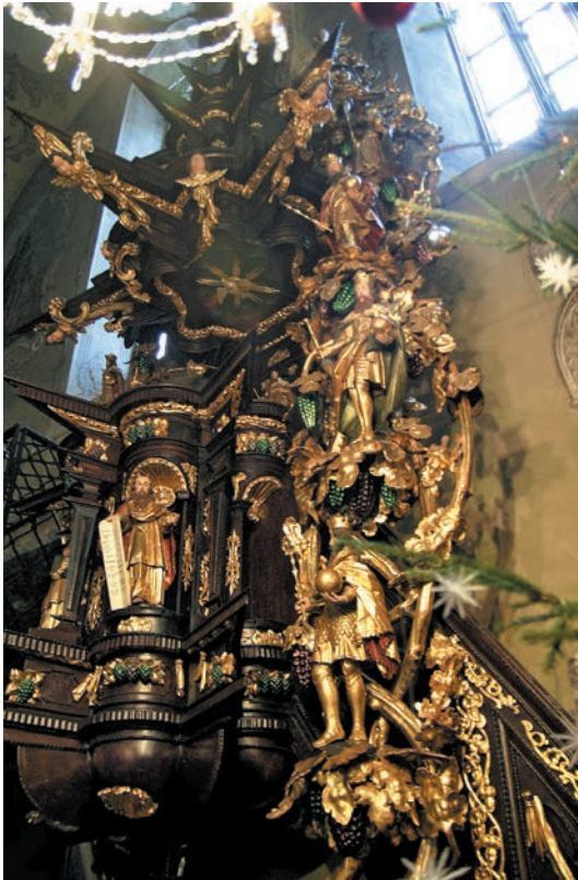
Ambona – Drzewo Jessego

w kolorze imitującym marmur dębnicki, ujęty parą kolumn z belkowaniem i rozerwanym przyczółkiem; po bokach jak i w jego zwieńczeniu