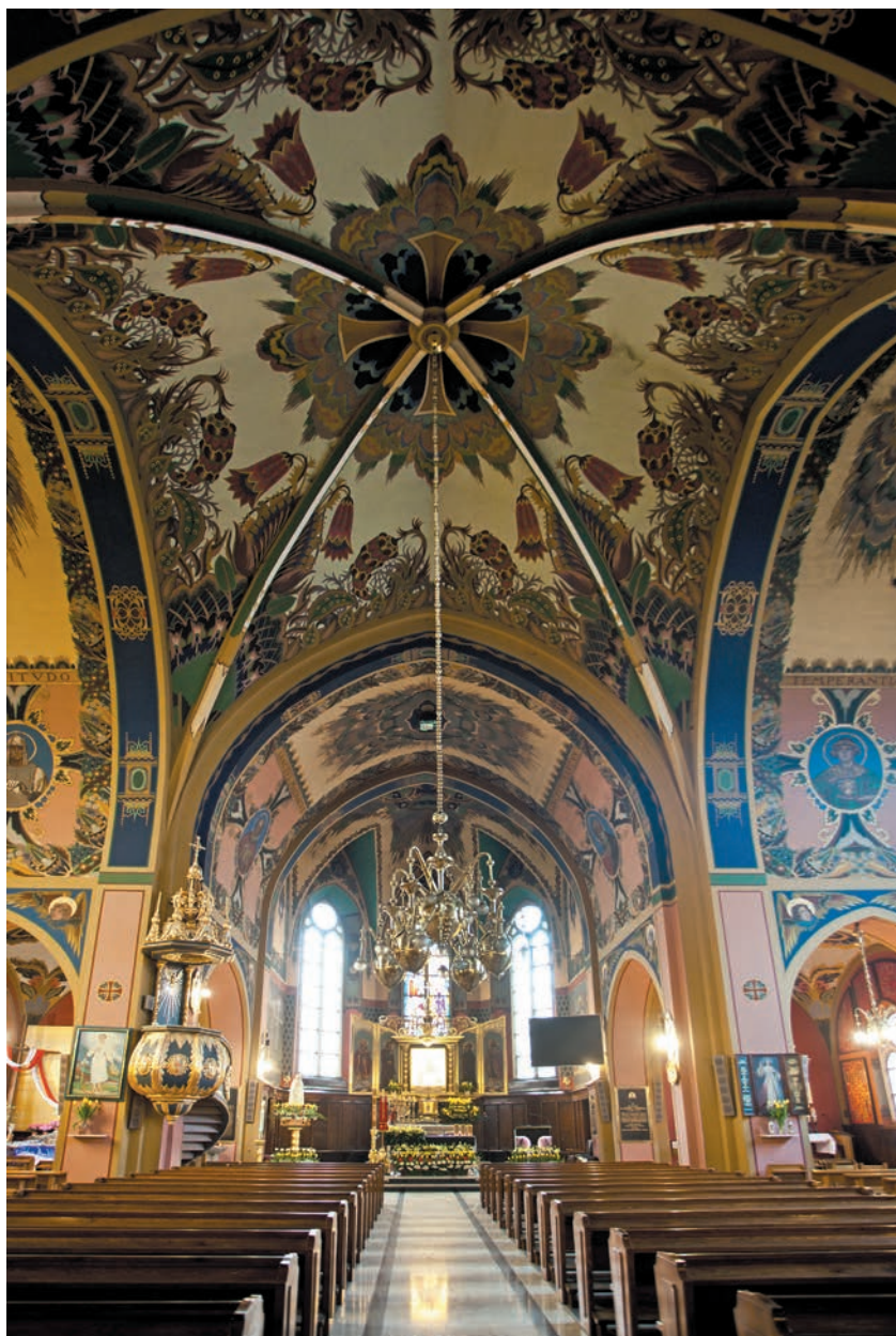
Nawa główna z polichromią Jana Bukowskiego