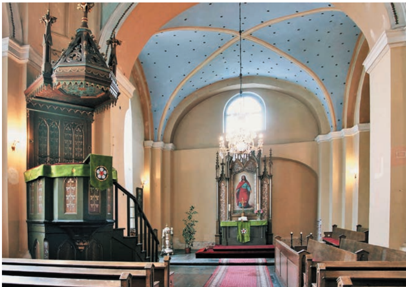
Wnętrze dawnej kaplicy Przemienienia Pańskiego – obecnie kościół protestancki

ków 30 . Protestanci w większości nie budowali dla nowych kościołów, zajmowali dawne świątynie klasztorne opustoszałe po kasatach.