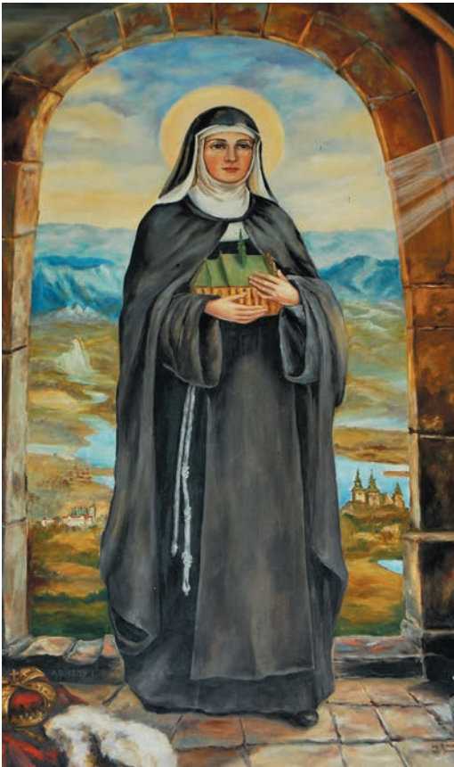
Św. Kinga – obraz kanonizacyjny