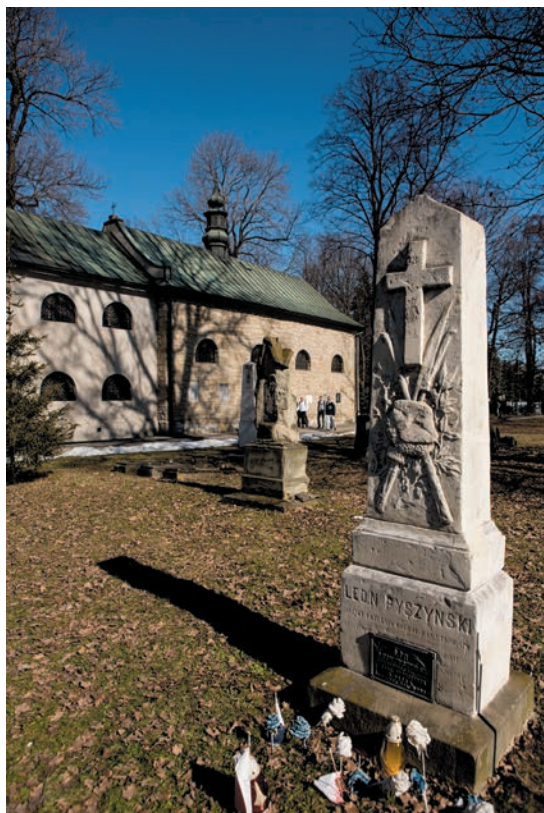
Kościół z fragmentem Starego Cmentarza

zastrzelonego w 1934 r. i pochowanego na Starym Cmentarzu. Po II wojnie światowej teren ten stał się miejscem pochówku rozstrzelanych przez okupanta niemieckiego Polaków z Nowego Sącza i okolicy. Po 1945 r. we wspólnej mogile złożono szczątki ofiar bohaterów ekshumowanych z różnych miejsc straceń: Nowego Sącza, Biegonic, Rdziostowa, Młodowa, Olszana,