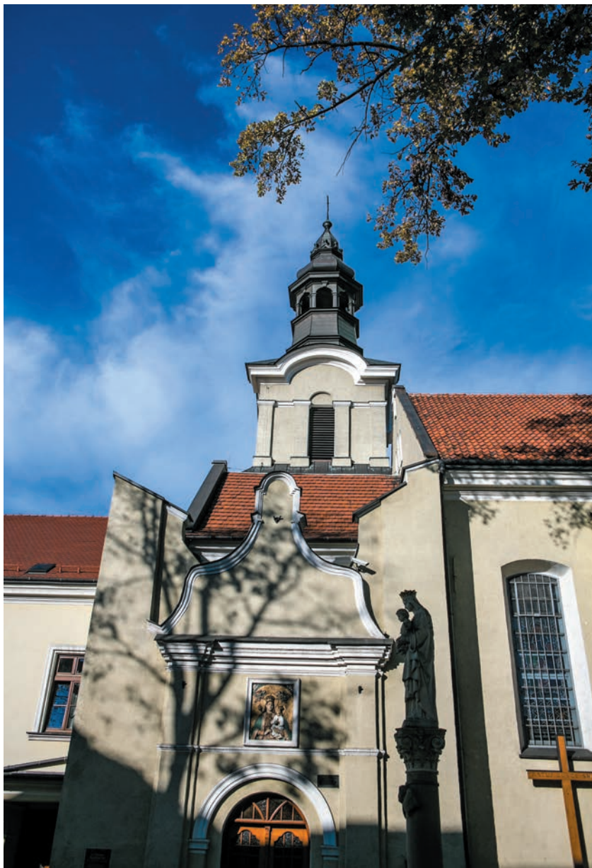
Kościół Świętego Ducha