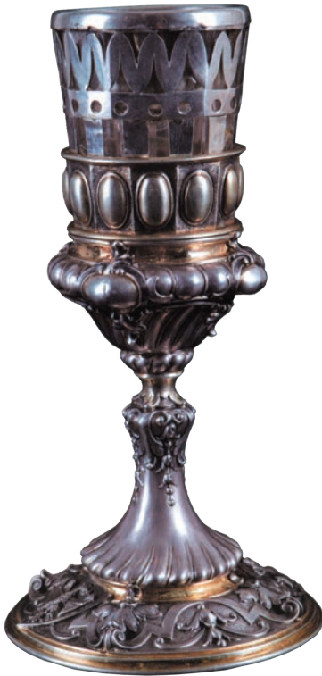
Kielich św. Kingi

Najcenniejszymi obiektami przechowywanymi w klasztorze są pamiątki według tradycji należące do św. Kingi, pochodzące z drugiej połowy XIII