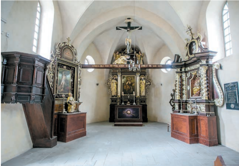
Wnętrze z ołtarzem głównym i bocznymi