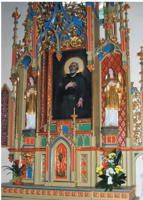
Ołtarz św. Andrzeja Boboli