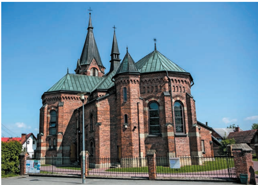
Kościół św. Wawrzyńca od wschodu