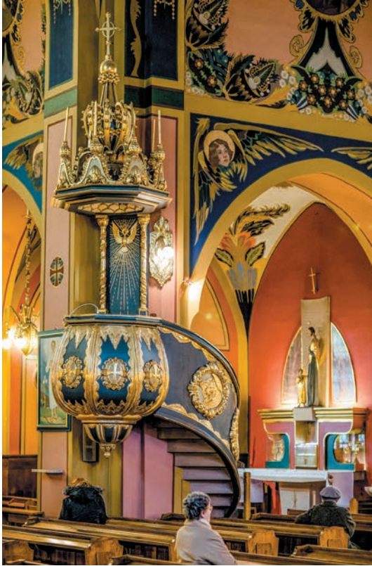
Ambona ufundowana staraniem 1. Pułku Strzelców Podhalańskich