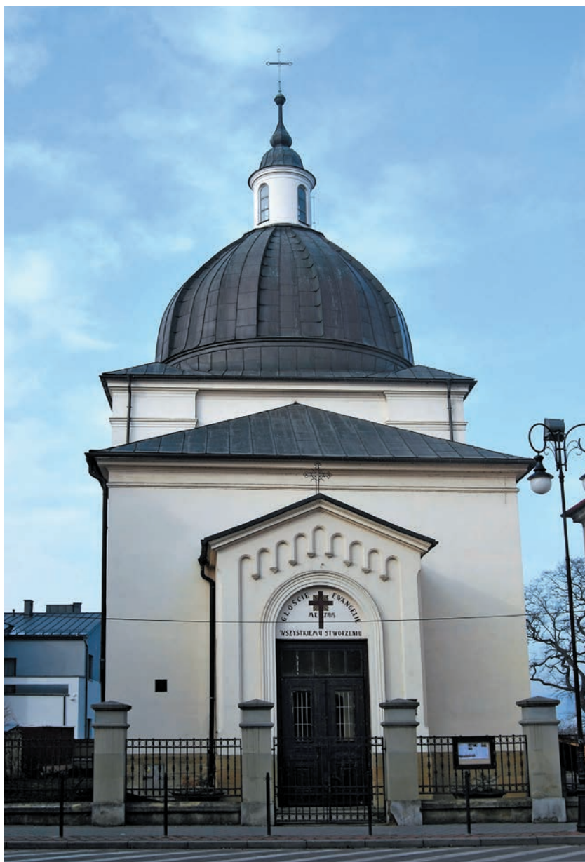
Dawna kaplica Przemienienia Pańskiego, obecnie kościół protestancki