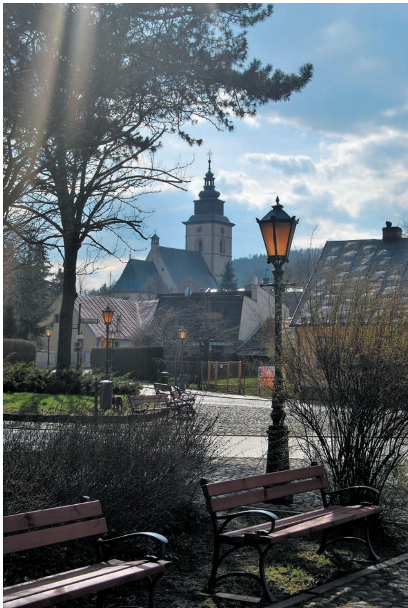
W głębi kościół św. Elżbiety