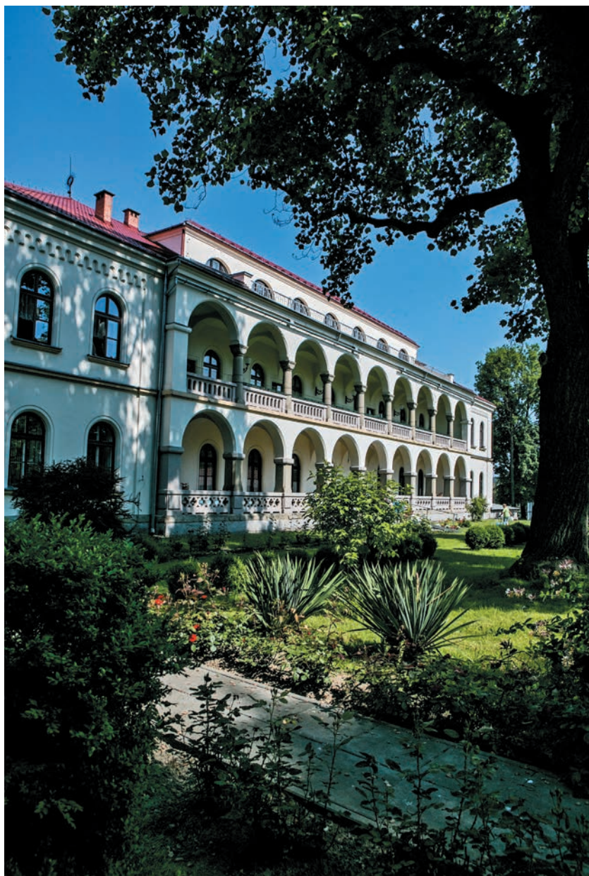
Krużganki od strony wschodniej