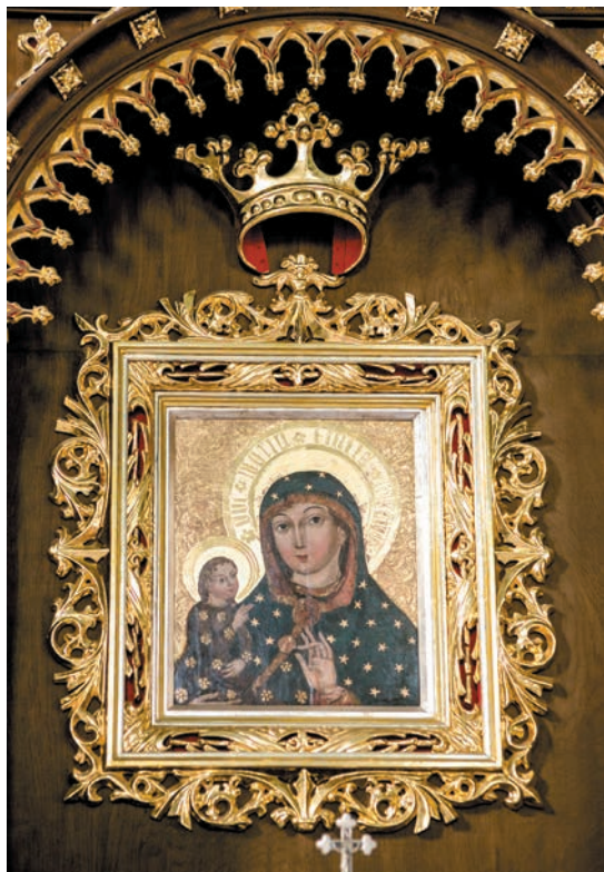
Matka Boża Biegonicka