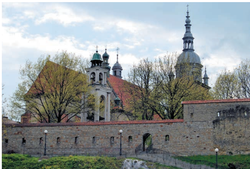
Bazylika od północnego wschodu

Wieża północna (wyższa wieża kościoła – ongiś strażnica miejska), wzniesiona około 1470 r., zawdzięcza swój obecny wygląd pracom renowa-