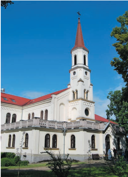
Biały Klasztor od południowego zachodu

Założenie klasztorne przetrwało do czasów obecnych zasadniczo w niezmienionej formie. Jediną zmianą, widoczną w zewnętrznej bryle budowli