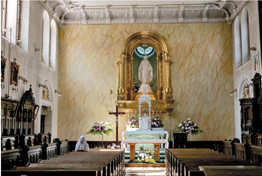
Wnętrze kaplicy klasztornej

Forma czworobocznego założenia zastosowana przez architekta wyraźnie odwołuje się do planów tradycyjnie używanych w budownictwie klasztornym, zaś neoromańskie detale zdobnicze stanowią nawiązanie do średniowiecznych kompleksów klasztornych. Wprowadzenie loggii od strony ogrodu miało natomiast zastąpić krążanek dziedzińca, z którego zrezygnowano na rzecz okien.