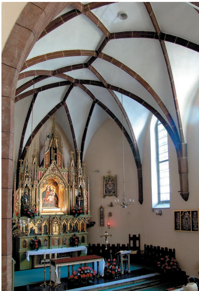
Gotyckie prezbiterium ze sklepieniem sieciowym