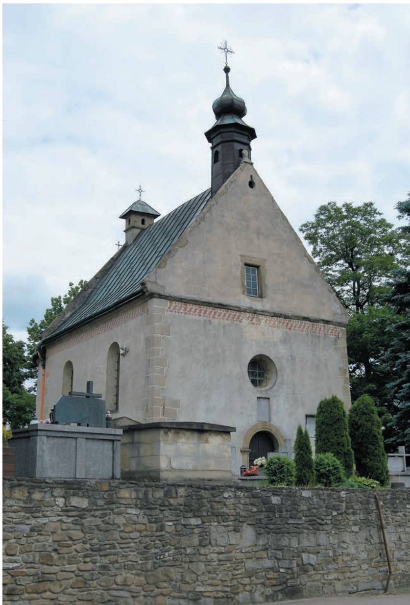
Kaplica św. Rocha i św. Sebastiana