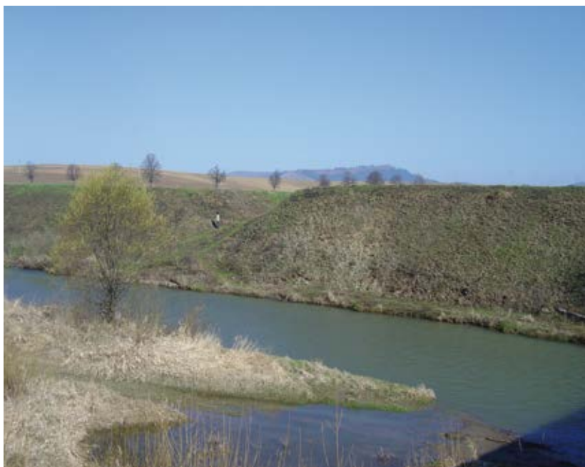
Hlboký cestný zárez – predpokladaná poloha brány.

ným smerom vedľa zásekov až k Vojnianskej hore ( Schurberg ). Posledná zmienka o zásekoch je v listine z roku 1298 10 , v ktorej spišský župan Bald oslobodil kráľovských strážcov zo Strážok ( Ewr ) od povinnosti strážiť záseky na mýtnej kráľovskej bráne pri dedine Vztrugar ( Stragar ).