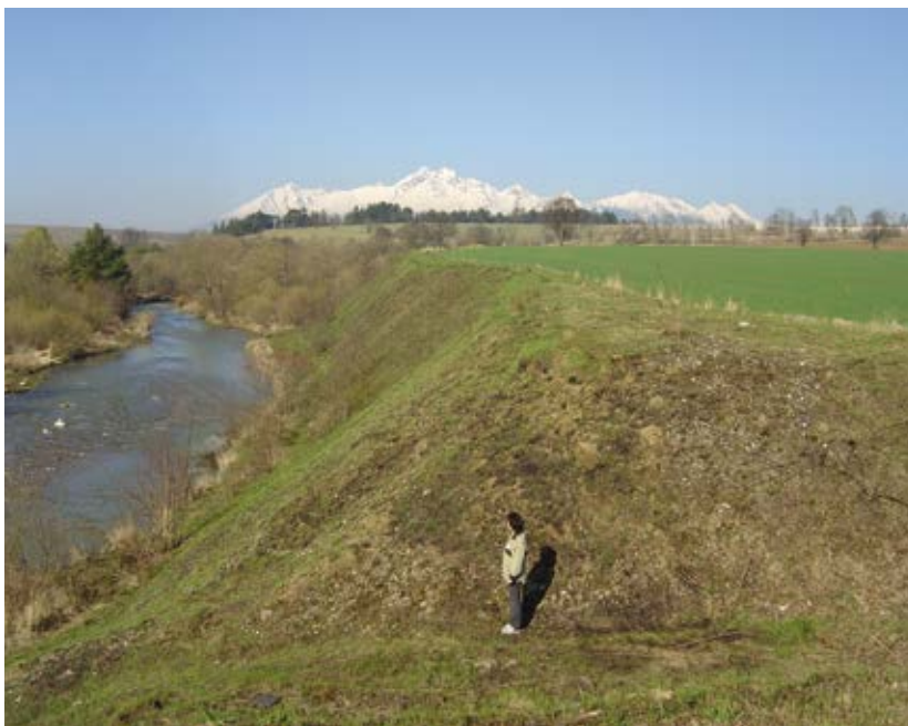
Terasa nad ľavým brehom riečky Biela.

☛ Tieto záseky a krajinská brána sa spomínajú v darovacích kráľovských listinách z 13. storočia. Ide o listinu z roku 1256 - Belo IV. daroval kráľovský les po oboch stranách rieky Poprad medzi zásekmi kráľovstva a konfíniom s Poľskom komesovi Jordanovi, pričom hranica darovaného územia začínala od krajinskej brány 6 . V listine z roku 1272 dostal komes Polan od Štefana V. les na pravej strane rieky Poprad od vrchu Gala pri Kežmarku až po bránu konfínia s Poľskom pri rieke Poprad 7 . V listine z roku 1282 daroval kráľ Ladislav IV. trom synom Zumbotha a komesovi Arnoldovi zem Stragar a Čierny les, pričom hranica územia záverom schádzala (zo Spišskej Magury) na východ popri uzavretom záseku až ku krajinskej bráne, kde tiekol potok a popri potoku k rieke Poprad 8 . Záseky sa spomínajú aj v listine z roku 1297 9 , v ktorej komes Ján z Hrhova umožňuje nemeckým kolonistom usadiť sa v Podhoranoch ( Meldur ), hranica ich územia stúpala od rieky Poprad západ-