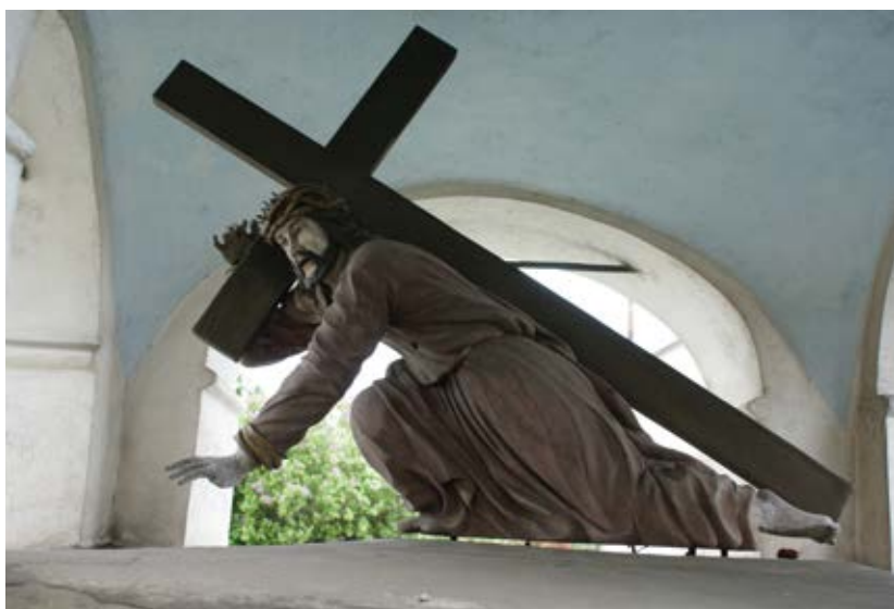
Socha Krista, kaplnka na rázcestí, Kežmarok.