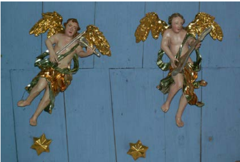
Neznámy rezbár. Muzicírujúci anjeli z nebeskej hudby, Kaplnka Panny Márie Karmelitánskej, Kostol sv. Stanislava, Frídmán, okolo roku 1764.

nia kaplnky a jej výzdoby vrátane do kruhu usporiadaných nebeských hudobníkov evokuje súvislosti s predstavami o existencii kozmickej hudby (musica mundana), vytvárajenej pohybom planét. Tento dojem umocňuje číslo osem, ktoré sa vzťahuje tak na počet hudobníkov na strope kaplnky, ako aj predstavu o počte nebeských sfér, aká prevládala v neskorobaroanticko- a ranokresťanskej filozofii. 13 Myšlienka hudby sfér zažívala v období baroka svoj návrat do filozofického myslenia, i keď s inou rovinou argumentácie ako v prípade stredovekej teológie. Archaickosť výzdoby kaplnky vo Frídmáne spočíva nielen v samotnej téme, ale aj vo forme podania idey nebeskej hudby. Napriek tomu, že anjelskí hudobníci – spevák so stratenými notami, violončelista, dvaja huslisti, harfista, hráč na dlhokrú cistru a dvaja trubači sú stvárnení v hudobnej akcii – ich nástroje majú predovšetkým význam atribútu. Nezasťrie to ani fakt, že sú ľahko identifikovateľné a patrili do dobového inštrumentára, dokonca v niektorých detailoch sú moderné a zodpovedajú nuansám dobovej praxe (napríklad moderná forma a držanie sláčika, alebo párové použitie trúbok). 14 Ich umiestnenie na strop sakrálnej stavby nad oltárom je príkladom netradičného a ojedinelého riešenia vytvárania ilúzie hudobného neba, ktoré pripomína bežnú koncepciu výzdoby klenieb presbytéria gotického chrámu formou nástennej maľby, ale v nami skúmanom období v takto koncipovanej sochárskej realizácii nemá na území Slovenska paralelu.