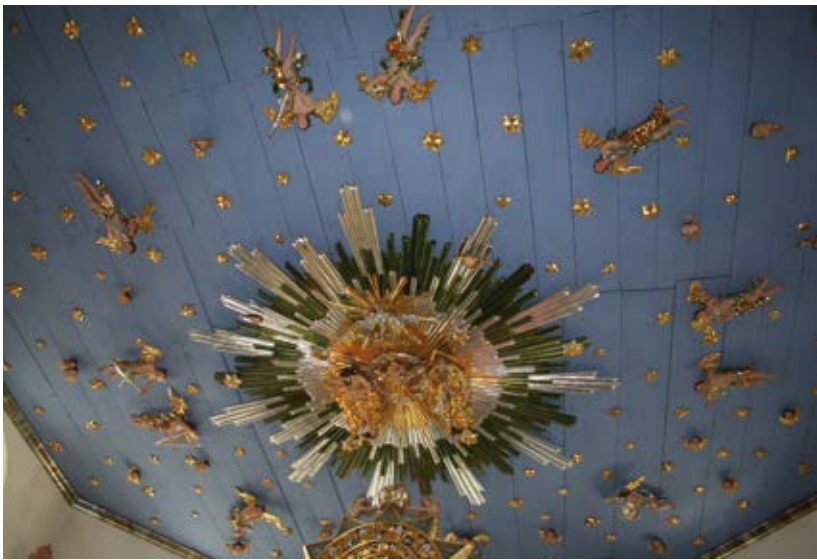
Neznámy rezbár. Korunovanie Panny Márie s nebeskou hudbou, Kaplnka Panny Márie Karmelitánskej, Kostol sv. Stanislava, Frídmán, okolo roku 1764.

ro omaľovanej drevenej konštrukcie, ku ktorej je pridaná pomerne bohatá rezbársky vykonaná výzdoba evokujúca dojem neba. Centrum tvorené nesmierne bohatou svätožiarou vychádzajúcou spoza figúr Korunovacie Panny Márie Najsvätejšou trojicou sa voľne prepája s vrcholom tabernákulového oltára. Výjav dopĺňa trojica nápisových pásov so slovom FIAT – nech sa stane. Dookola ho sprevádza séria anjelov. Štyria z nich nesú symbolické predmety mariánskeho kultu ako napríklad ruženec či veniec. Priestor medzi nimi vyplňajú dvojice ôsmich rovnako veľkých anjelov s hudobnými nástrojmi, spodobujúc tak nebeský chór oslavujúci uvedenú mariánsku scénu.