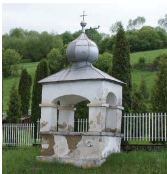
Kaplnka prícestná, Nižné Ružbachy.