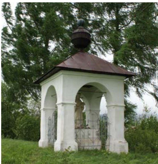
Kaplnka sv. Jána Nepomuckého v Plavči.