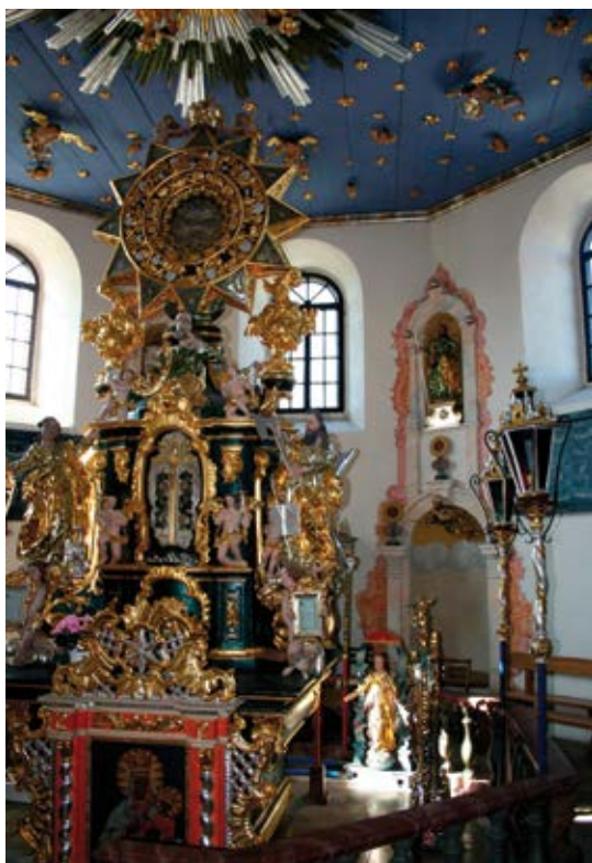
Neznámi autori. Kaplnka Panny Márie Karmelitánskej, Kostol sv. Stanislava, Fridman, okolo roku 1764.

☞ Okolo oltára je v rohoch polygonálnej architektúry osem dvojíc nad sebou umiestnených ník, prepojených spoločným dekoratívnym rámom. V konchách spodného radu ník sú zavese- né polychrómované rezby starozákonných kráľov Dávida, Šalamúna a tiež šiestich prorokov, kde literatúra uvádza, že jedným je „cudzí prorok“ Balaam 8 a u ďalších z nich možno nájsť štvoricu symbolov z Ezechielovho videnia, používaných neskôr hlavne ako atribúty štyroch evanjelistov. No okrem býka neskôr typického pre evanjelistu