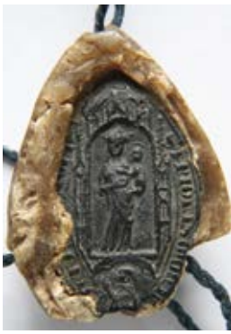
Stredoveká pečať priora benediktínskeho kláštora v Štôle z listiny vydanéj v roku 1437.