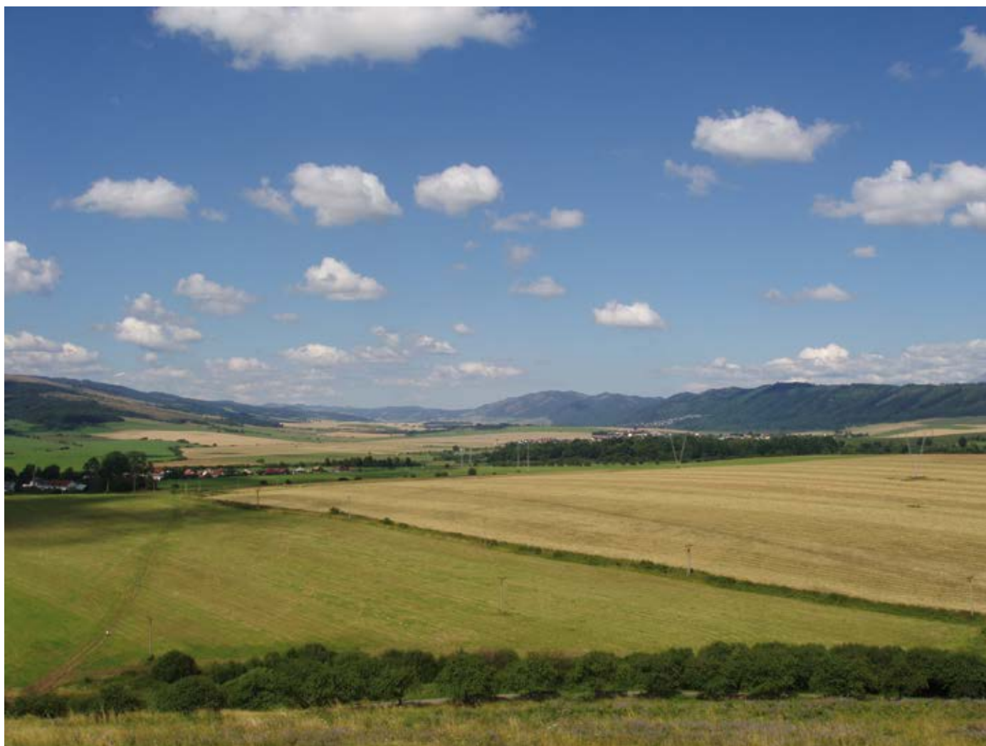
Mariánske údolie – vpravo (v dnešnom parku) stálo cisterciacké opátstvo.