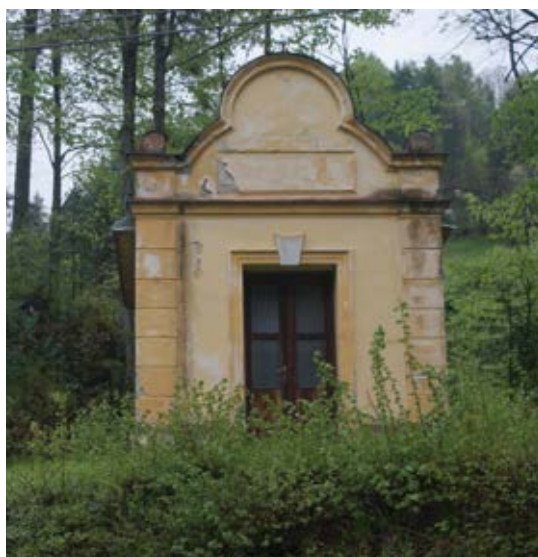
Kaplnka Sedembolestnej P. Márie, Mníšek nad Popradom – Pilhov.