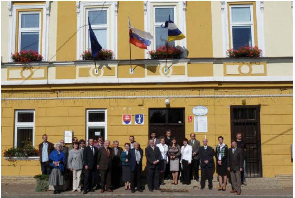
Účastníci konferencie pred Obecným úradom v Žakovciach.

☛ Tretí deň konferencie bol venovaný spoznávaniu kultúrneho dedičstva Spiša. Počas krátkej exkurzie si účastníci obzreli exteriér Kostola sv. Ladislava v Spišskom Štvrtku, Radničné námestie v Spišskej Novej Vsi a kostolov vo Vítkovciach, Chrasti nad Hornádom, Spišských Vlachochoch a Žehre. Celkovo za dva rokovacie dni odznelo