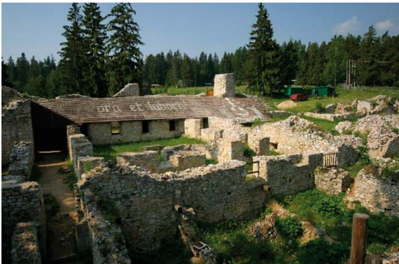
Ruiny kartuziánskeho kláštora na Lapis refugii.