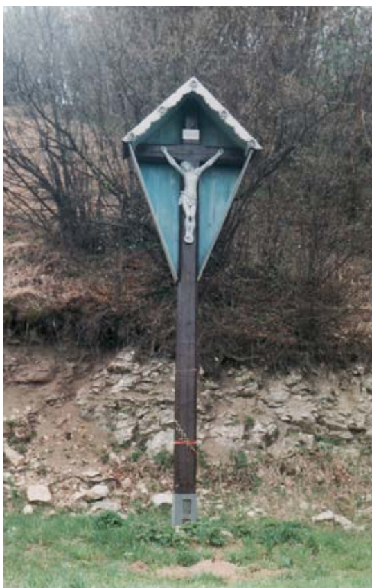
Križ v poli, Kyjov.

stavieb alebo zaniknutých cintorínov. Drobné sakrálné objekty sa na liturgické účely používajú prevažne raz v roku, na sviatok patróna. V súčasnosti sa v našich dedinách – v mesiaci máji – obnovila tradícia organizovania procesií ku kaplnkám do polí za účelom posvätenia novej úrody.