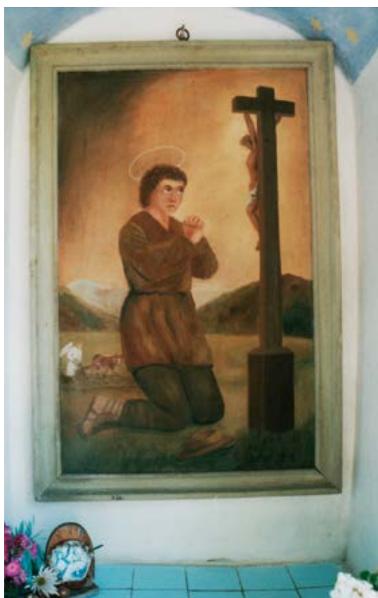
Interiér – obraz sv. Izidora, Vyšné Ružbachy.

Krista, maľovaným na plechu. Zdobené plechové oválne striešky na krížoch sú pozostatkom práce spišských drotárov. Ramená dreveného kríža sú prevažne otesané na hladké hranoly, iba v gréckokatolíckych obciach Litmanová a Jarabina, kde boli nájdené vyrezávané kríže zo začiatku 20. storočia, zobrazujúce nástroje a predmety umučenia Ježiša Krista. Na stavbu kríža sa do súčasnosti vyberá prevažne drevo zo smreka opadavého (červeného smreka). V obciach Nižné a Vyšné Ružbachy používali na stavbu krížov miestny travertín. Výskyt krížov je naozaj početný, v jednej obci nájde me až 5 – 6 krížov.